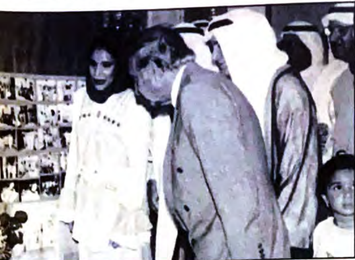
○ وزير التربية والتعليم ورئيس غرفة التجارة خلال جولة في المعرض ○

الدكتور علي فخر وزير التربية والتعليم أشاد بهذه الخطوة الجريئة للنادي الأهلي وقال: أود أن أهنيء النادي الأهلي على هذا الجهد الطيب والنشاط الاجتماعي المفيد لابنائنا الطلبة خلال فترة الصيف بما يحفظ أبناءنا أثناء العطلة الصيفية من الفراغ والملل وأتمنى أن تبادر جميع مؤسساتنا الاجتماعية في القيام بمثل هذا النشاط إذ ان فراغ الطلبة خلال فترة الصيف يقلقني في وزارة التربية والتعليم.. وما تقوم به المؤسسات الرياضية والشبابية والاجتماعية خلال فترة الصيف من أنشطة وبرامج لابنائنا الطلبة، يعد تكملة لما تقوم به وزارة التربية والتعليم أثناء