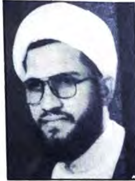
بقلم: الشيخ محسن عبدالحسين العصفور

كما أن الذبح إذا أدى الى قطع الرأس بكامله دون مجرد فري الأوداج يسبب الحرمة أيضاً والحكم بكون المذبوح ميتة، وكذلك إذا كان موت الدجاج بعد التذكية قد استند الى الخنق بالتفطيس في الماء لا إلى التذكية نفسها حيث تغطس قبل سكون أعضائها وخروج روحها في أحواض حارة لإزالة ريشها الى غير ذلك من الإشكالات الفقهية التي لم يثبت رعايتها في تلك المصانع على الرغم من وفرة اللحوم في كثير من الدول الإسلامية وبمواصفات استثنائية وقياسية وفي مراعي طبيعية خصبة كإيران وسوريا وتركيا وغيرها ووفرة الامكانيات لجلبها منها بل الطرق التجارية السائدة وعبر وسائل النقل الجوية والبرية والبحرية المختلفة.