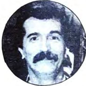
زوران مدرب السلة

مع الفريق اليوناني في نهائي كأس العالم.. هناك لاعب صانع الألعاب للفريق اليوناني قصير القامة، ولكن الذكاء والمهوية والمهارات العالية جعلته يتفوق في هجومه على عامل الطول المتوفر لدى اللاعبين الأمريكيين..