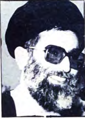
السيد علي خامنئي

الوحدة والتقريب مطلب واجب على العلماء السعي لتحقيقه وأن التهاون أو التساهل في تحقيقه غير جائز شرعاً.