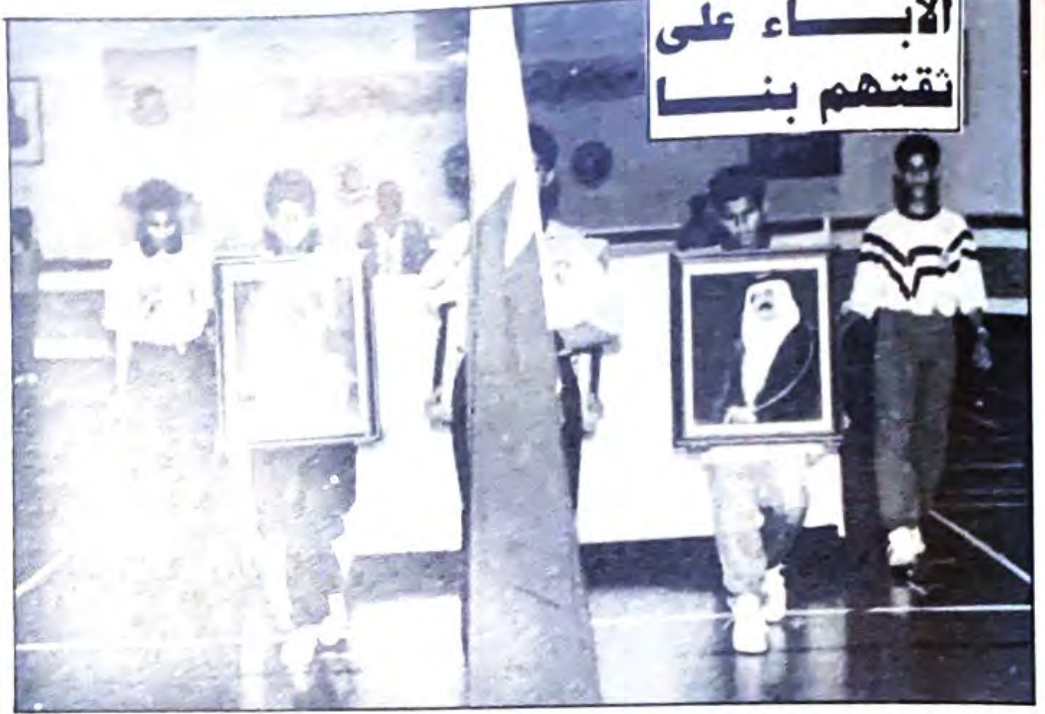
○ جانب من العروض الفنية المتميزة التي قدمها طلبة المركز الصيفي ○