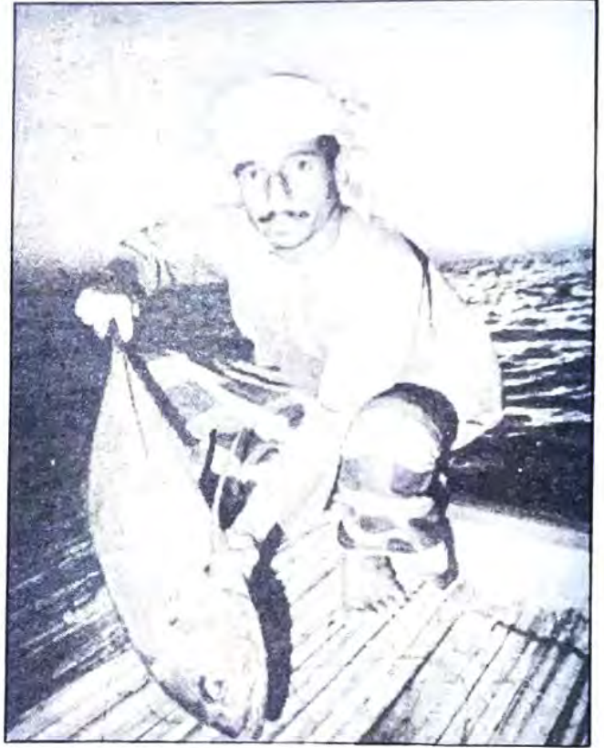
○ قطاع الاسماك في الامارات مملوك بالكامل للمواطنين ○

مزاولة عمليات تصدير الاسماك المحلية الطازجة وتحظر القوانين السمكية تصدير بعض الأصناف المهمة التي يستهلكها المواطن الإماراتي مثل الهامور والجميد والجنم والكنعد والصفافي والشعري والحمام. وهناك مجال واسع لتصدير أصناف الاسماك غير المرغوبة من قبل المستهلكين.