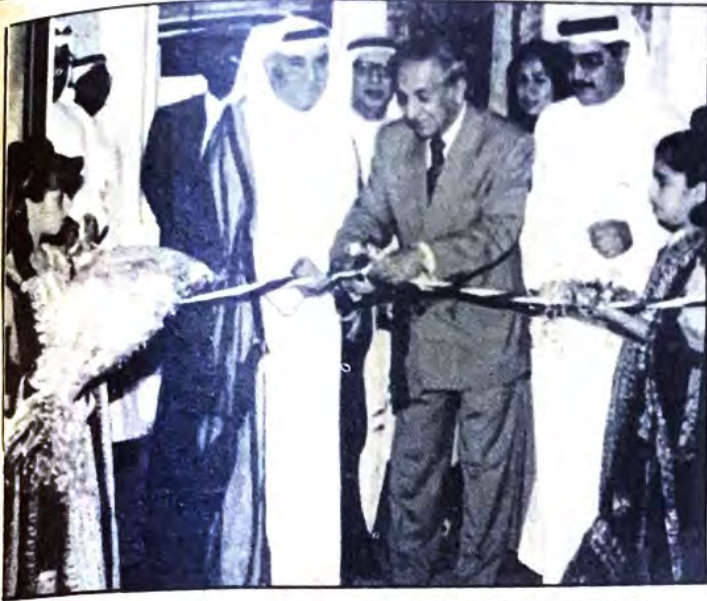
○ وزير التربية والتعليم يفتتح الحفل الختامي ○

مركز الأهلي الصيفي كان لها لقاء خاصاً بربان السفينة الأهلاوية فأبدى سروره بالجهود التي بذلت من قبل المشرفين والمشرفات في المركز الصيفي الذي وضعوا بصماتهم وعلامة نجاح المركز من خلال فعاليات الحفل الختامي حيث تواصل النجاح طوال شهري الصيف وعكسوا صورة النجاح في حفل الختام.