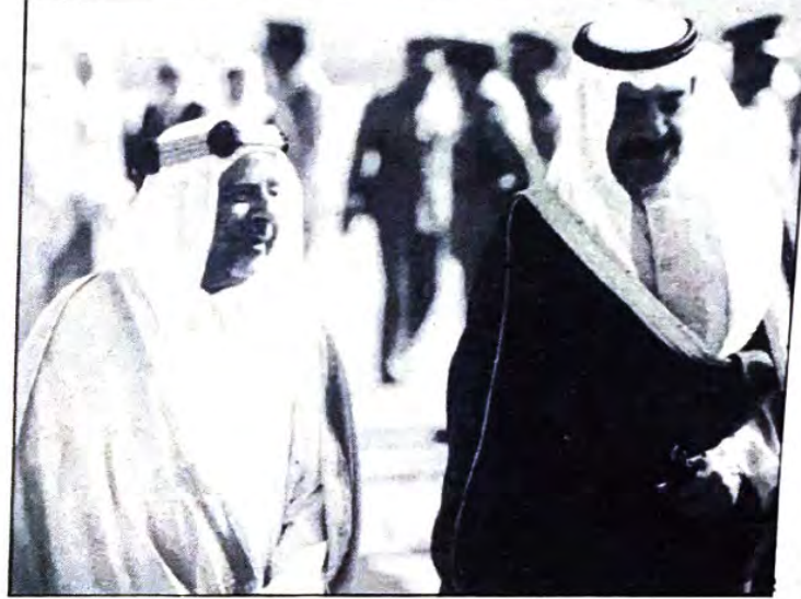
○ سمو الأمير في مقدمة مستقبلي سمو رئيس الوزراء

وسمو الشيخ راشد بن عيسى آل خليفة وسمو الشيخ محمد بن عيسى آل خليفة وسمو الشيخ عبدالله بن عيسى آل خليفة وسمو الشيخ احمد بن محمد آل خليفة والسادة الوزراء ورئيس مجلس الشورى وعدد من كبار المسؤولين في الدولة من مدنيين وعسكريين وجموع من المواطنين .