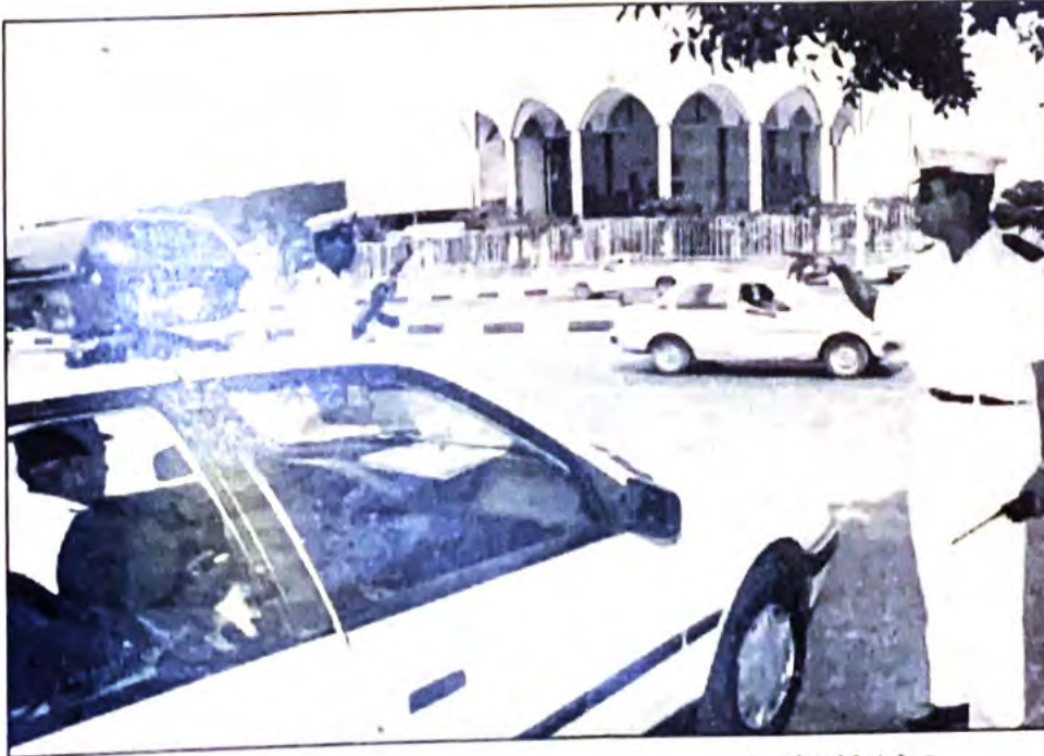
○ مقر اجتماع المؤتمر ○

وبالنسبة للحكومة فلا سبيل للترجع عن عقد هذا المؤتمر حيث