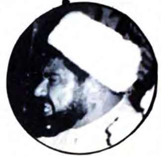
○ الشيخ محمد حبيب ○