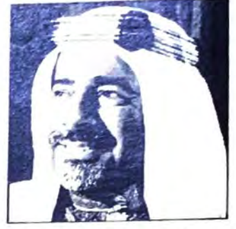
○ سمو الامير المفدى ○