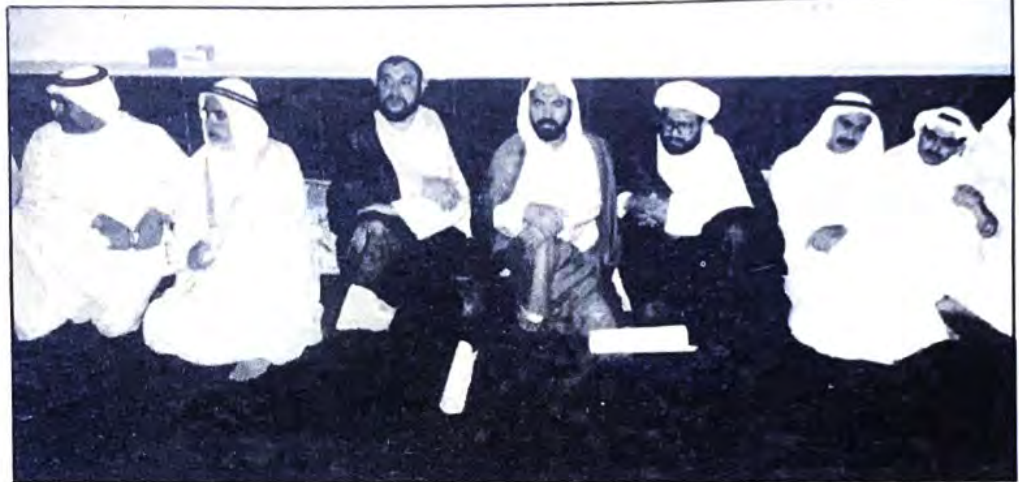
○ جانب من اصحاب الفضيلة العلماء الذين حضروا الحفل ○