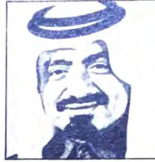
○ سمو امير دولة قطر ○

٤٤٠ طريق ١٧٠٥ الحفرة ٣١٧ مقابل مركز قيادة امن النامة - هاتف : ٢٩٣٣٨٣