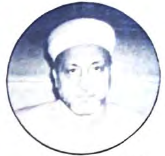
○ الشيخ الدكتور حلباني