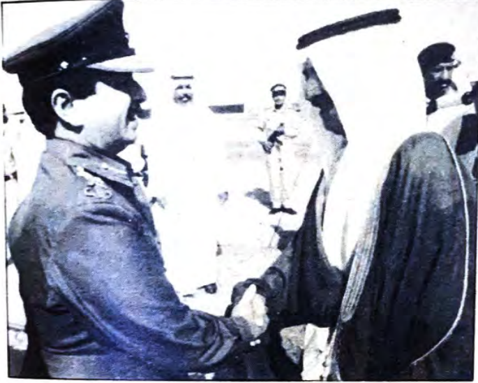
○ سمو ولي العهد في الاستقبال