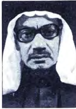
بقلم مهدي محمد السويديان القطيف

فخديجة عليها السلام ضحت في سبيل معتقدها بمكانتها الاجتماعية المرموقة وبذلت أموالها في حب رسول الله محمد صلى الله عليه وآله وسلم، ونصرته ففوضها الله سبحانه وتعالى في العاجل والأجل بما لم يكن في الحسبان. ففي الدنيا جعلها الله وعاءً لسيدة نساء أهل الجنة فاطمة بنت محمد (ص) الذي قال فيها محمد (ص): «فاطمة بضعة مني، إلخ»، وقال صلى الله عليه وآله فيها عليه السلام: «ذرية كل نبي من صلبه