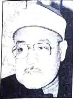
○ الشيخ محمد الغزالي ○

عاصفة من الإدانات قبول بها المؤتمر الدولي للسكان الذي تنظمه الأمم المتحدة اليوم الاثنين في القاهرة، حتى قبل أن يعقد، فهذا المؤتمر يلقي معارضة عالمية لم يواجهها مؤتمر من قبل لأن القضايا الأساسية التي يطرحها متعارضة بكشل صريح مع الأديان السماوية.