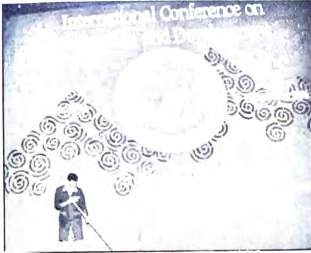
○ شعار المؤتمر الدولي للسكان والتنمية ○

وهذا النوع من الإجهاض يدخل تحت ضرورات حياة الأم عندما تكون معرضة للخطر كما في حالات أمراض القلب المتقدمة وسرطان عنق الرحم.