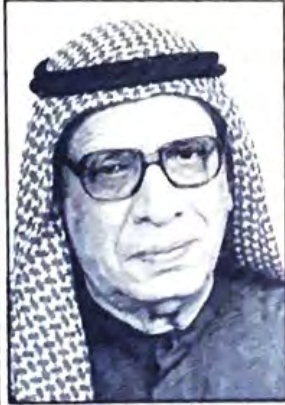
○ الوجيه عبدالرحمن كانوا ○

تلقينا الرسالة الرقيقة التالية من الأخ الوجيه عبدالرحمن كانوا رئيس مجلس إدارة النادي الأهلي بشأن المتابعة الجيدة للصفحة الرياضية بالمواقف للأحداث الرياضية وتغطيتها، ونحن إذ نشكر الوجيه السيد عبدالرحمن كانوا على هذه الرسالة، نرجو أن نكون عند حسن ظن الجميع وفيما يلي نص الرسالة: