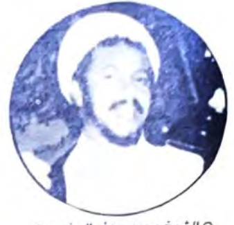
○ الشيخ محمد جعفر الجفري ○