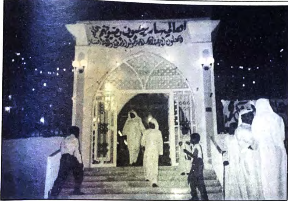
○ مبنى مأتم سار من الخارج ○