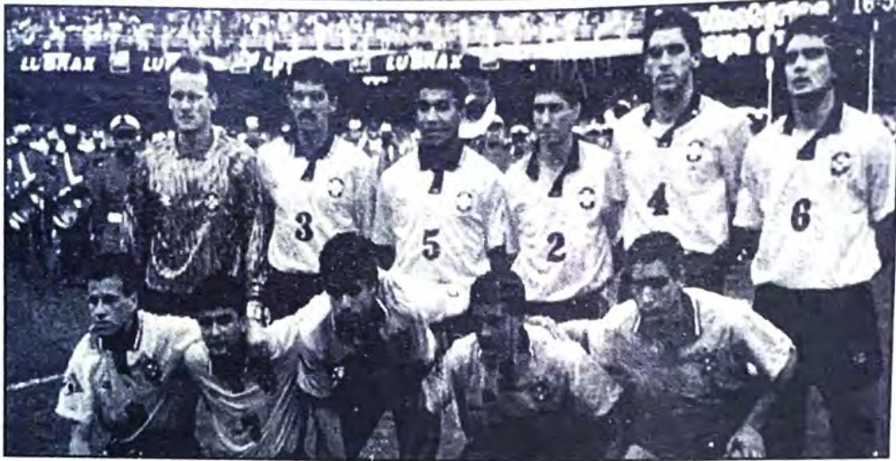
○ منتخب البرازيل .. بطل كأس العالم ٩٤ ○

النيجيريين وهم يتناقلون الكرة بكل ثقة في جميع أنحاء الملعب واستطاعوا ان يقتلوا الوقت ولكن كثرة المبالغة جعلتهم يدفعون الثمن لانه كان بإمكانهم احراز هدف ثان ولكن اكتفوا بهذا الهدف ومارسوا تضييع الوقت ... حتى هدف باجيو جاء عن طريق كرة شتتت الى الخارج ومن رمية تماس وصلت الكرة الى باجيو ليحرز هدف التعادل ومع هذا يجب ألا ننسى ونتعلم كيف نضيع الوقت بدون فوضى وبدون قتل متعة المستوى وان