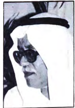
بقلم علي محمد المهدي الكويت