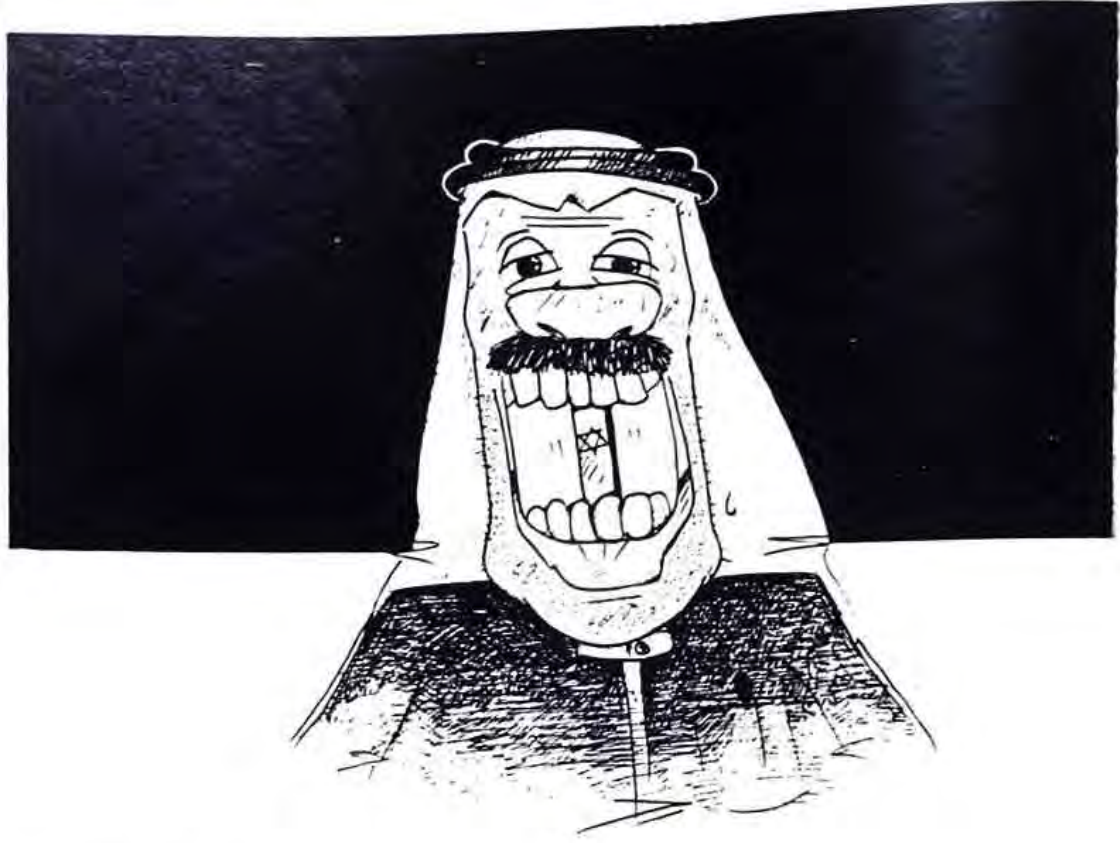
ريشة: حمد الغائب