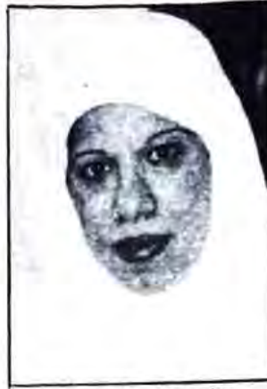
○ فهدية الزيرة ○

العربية حول التثقيف والتدريب التعاوني من حيث مفهومه، خصائصه، أهدافه ومجالاته ووسائله وموضوعاته والجهات التي تقوم بها مستعرضاً بعض تجارب التثقيف والتدريب والتعليم والتعاوني.