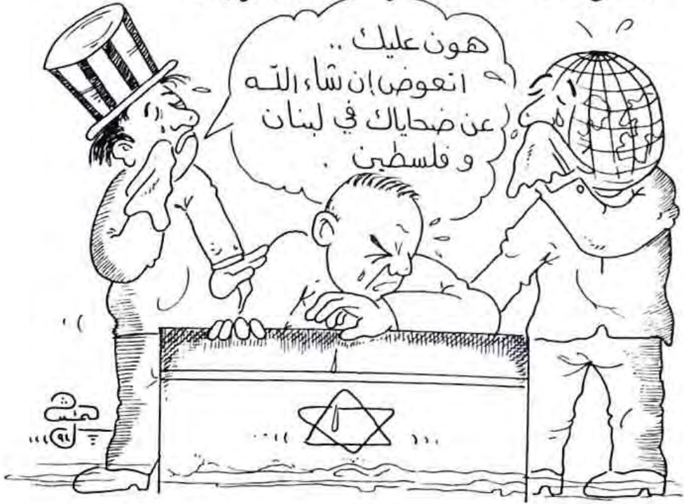
ريشة: هيثم عبدالله أحمد