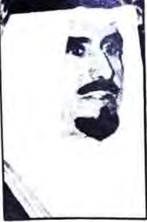
○ الشيخ جابر الأحمد الصباح

غداً الثلاثاء ٢ أغسطس تمر ذكرى الإحتلال الرابعة، وبهذه المناسبة يرى كل كويتي مخلص أن عليه واجباً مفروض الأداء، عليه واجب الحمد والشكر لله أولاً، الذي خلصه من بين أنياب عدو شرس لا يعرف الرحمة ولا يعرف الإنسانية، ملء قلبه بحقد أسود على الكويتيين وعلى البشرية جمعاء، ثم الثناء لعباد الله من الرجال المخلصين لمبادئهم والأوفياء لدينتهم وعقيدتهم الذين ناصروا الحق ووقفوا بجانبه حتى تحقق النصر المبين، هؤلاء الشرفاء الذين طوفوا الكويت وشعبها بإحسانهم ومعروفهم إلى يوم يرث الله الأرض ومن عليها، هؤلاء الأحياب الذين تكن لهم في قلوبنا الحب والتقدير والعرفان بالجميل، وأخص بالذكر خادم الحرمين الشريفين وشعبه الطيب وحكومته الرشيدة، وأمير دولة البحرين وشعبه المضياف والقيادة الحكيمة ولا ننسى دور السلطنة العمانية والسلطان قابوس وشعبه العريق، ولا ننسى قطر حكومة وأميراً وشعباً، وزايد الخير وشعبه وحكومته، ومن منا نحن الكويتيين ينسى الدور البارز لشعب الكنانة وقائده (المبارك) وكذلك الموقف الشريف للشعب السوري (أسده) المقدم والدول الصديقة والحليفة بقيادة الدولة الكبرى الولايات المتحدة الأمريكية برئاسة رمز الحرية والتحرر الرئيس السابق (جورج بوش)، لكل هؤلاء الشكر البالغ والثناء العميق من كل كويتي شريف.