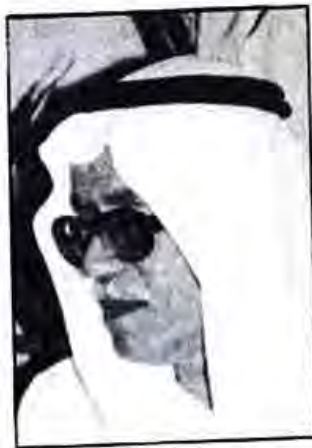
بقلم علي محمد المهدي الكويت

وكلمة أخيرة يحتم علي الشعور الوطني أن أذكرها وهي أن أهل الكويت جميعاً وبلا إستثناء مدينون بالولاء والوفاء