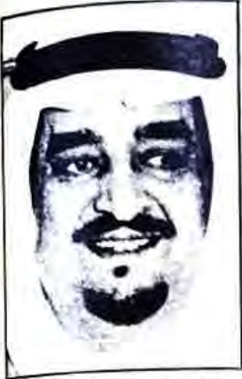
○ خادم الحرمين الشريفين ○