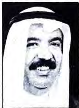
○ الشيخ عيسى بن علي آل خليفة وزير العمل والشؤون الاجتماعية ○

صدر عن حضرة صاحب السمو الشيخ عيسى بن سلمان آل خليفة أمير البلاد المفدى مرسوم بإنابة وزارية يقضي بتكليف الشيخ عيسى بن علي آل خليفة وزير العمل والشؤون الإجتماعية بالإضافة الى عمله القيام بأعمال السيد حبيب أحمد قاسم وزير التجارة والزراعة وذلك مدة غيابه في الخارج.