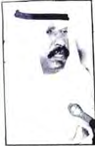
○ الشيخ سعد العبد الله

لرجل الكويت الأول، قائد المسيرة الكويتية صاحب السمو الشيخ جابر الأحمد الجابر الصباح أمير البلاد حفظه الله ورعاه، الذي لم تغض عيناه والكويت تحت الإحتلال، ان الأعمال البطولية التي قام بها سموه لا ينكرها إلا المكابرون الجاحدون، كان قوي الشكيمة صلب المراس لم يترك باباً إلا وطرقه حتى تم له ما أراد بتوفيق من الله وعونه، ولا ننسى أيضاً مواقف بطل الكويت الشجاع وإبنها البار الشيخ سعد الخير الذي ضحى بالكثير لأجل قائد الكويت الكبير ولأجل أرض الكويت الطاهرة، إنها الكويت التي أنجبت الفحول من الرجال من أمثال جابر العشرات وسعد الخير، والحديث عن الرجال الأوفياء يطول ويطول ولا حد له، ولكن أقول أن الرجال تُعرف على حقيقتها في المحن والأهوال وفي الشدائد والمصائب، أدام الله علينا نعمة الأمن والاستقرار، ورحم الله شهداءنا الأخيار وفك الله قيد أسرانا وأعادهم إلى أهلهم وذويهم سالمين غانمين آمين يا أرحم الراحمين.