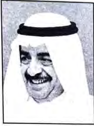
■ سمو رئيس الوزراء

وزراء دولة البحرين والسلام عليكم ورحمة الله وبركاته ... فقد تلقيت رسالة سموكم اثر مغادرتكم بعد زيارتكم لبلدكم الثاني المملكة العربية السعودية واني إذ أقدر مشاعر سموكم تجاه هذه الزيارة أؤكد أننا قد سررنا للقاء سموكم واخوانكم الوفد المرافق. وأرجو لكم دوام الصحة والسعادة الدائمة ولشعب البحرين موفور الرخاء والازدهار في ظل قيادة سمو الأمير الحكيمه.. وتقبلوا تحياتي وتقديري الأخوي ..