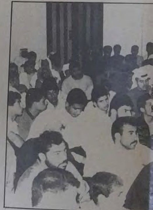
من العادي والمتخصص O