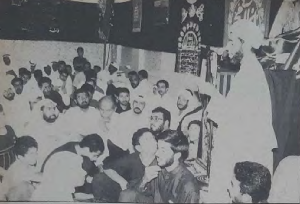
○ مراحل تطور عديدة مريها المنبر الحسيني ○