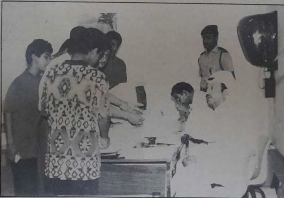
○ تسجيل أسماء العاطلين واعطائهم استثمارات الترشيح ○