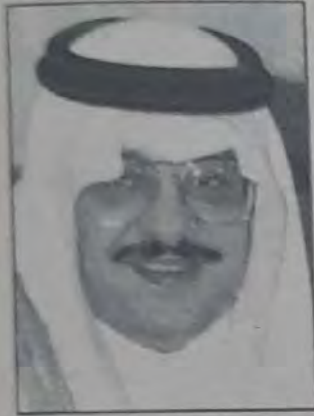
○ الأمير فيصل بن فهد ○

اقتربت نهائيات كأس العالم لكرة القدم من خواتيمها حيث تقام يوم بعد غد (الأربعاء) مباريات الدور نصف النهائي (دور الأربعة) والذي تأهلت له الفرق الفائزة من مباريات الدور الربع النهائي (الثمانية) والذي أقيمت مبارياته الليلة البارحة وبارحة أول من أمس (السبت).. علماً بأن المباراة النهائية ستقام في السابع عشر من الشهر الجاري في مدينة لوس أنجلوس.. وكانت ثمانية منتخبات قد تأهلت الى دور الربع نهائي وهي إيطاليا، أسبانيا، هولندا، البرازيل، بلغاريا، ألمانيا، السويد ورومانيا. بعد أن تمكنت من إقصاء المنتخبات التالية نييجيريا، سويسرا، أيرلندا، المكسيك، بلجيكا، السعودية والأرجنتين.