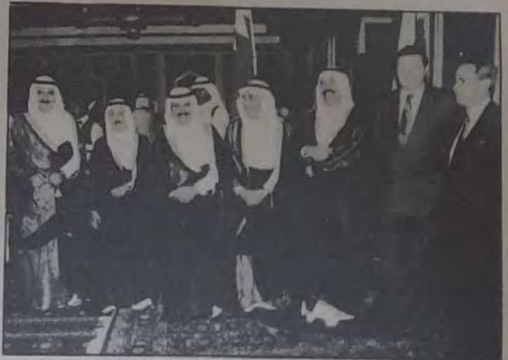
○ وزير المواصلات يتوسط وزير الصحة ووزير العمل ورئيس الديوان الأميري وعددًا من كبار المدعوين ○

أقام سمو الشيخ علي بن خليفة آل خليفة وزير المواصلات رئيس مجلس إدارة شركة البحرين للإتصالات السلكية واللاسلكية الاسبوع الماضي حفل استقبال بقاعة أوال بفندق الخليج بمناسبة مرور خمسة وعشرين عاماً على افتتاح أول محطة أرضية للأقمار الصناعية تقام في البحرين ومنطقة الشرق الأوسط. حضر حفل الاستقبال السادة الوزراء والسيد رئيس الديوان الأميري وسمو الشيخ أحمد بن محمد بن سلمان آل خليفة وكلاء الوزارات ورجال السلك الدبلوماسي وكبار المسؤولين في الدولة والوجهاء والأعيان وأعضاء مجلس الشورى وأعضاء مجلس إدارة شركة بتلكو وكبار المسؤولين بالشركة وعدد كبير من المدعوين. وقد عرض بهذه المناسبة فيلم وثائقي عن المحطة الأرضية واتصالات البحرين بمختلف دول العالم بشكل عام عبر محطة الأقمار الصناعية في البلاد.