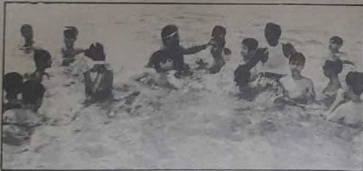
○ تعليم السباحة.. أحد برامج مركز النادي الأهلي ○

أضاف.. المسئولية مشتركة تجاه هذا القطاع الكبير من الناس حتى نخلق المواطن الصالح ولا نتركه عرضة للفراغ الذي يبعث على الملل والسأم ويصير عرضة لذوي المبادئ الهدامة «فكلكم راع وكلكم مسئول عن رعيته».. ونحن في النادي الأهلي عندما اخترنا هذا السن (7-13) فذاك لأننا وجدنا أنه في مقدورنا توجيهها فيما ينفعها بمزاوله الأنشطة على اختلافها والقيام بجولات لمختلف المرافق في البلاد..