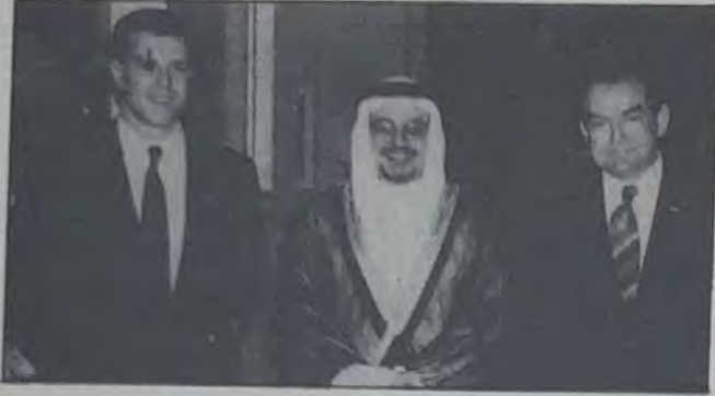
○ سمو الشيخ سلمان بن حمد آل خليفة مع القائم بالأعمال وأحد المسؤولين بالسفارة ○

أقام القائم بالأعمال الأمريكي السيد ديفيد روبنز لدى دولة البحرين حفل استقبال بمقر السفارة بالمحور بمناسبة الذكرى الثامنة عشرة بعد المائتين لاستقلال الولايات المتحدة الأمريكية، وحضر الحفل عدد من الوزراء وكبار المسؤولين بالدولة والوجهاء ورجال الأعمال وعدد من أعضاء مجلس الشورى وعدد من المدعوين ورجال الصحافة والإعلام وقدم الجميع التهاني إلى القائم بالأعمال بهذه المناسبة.