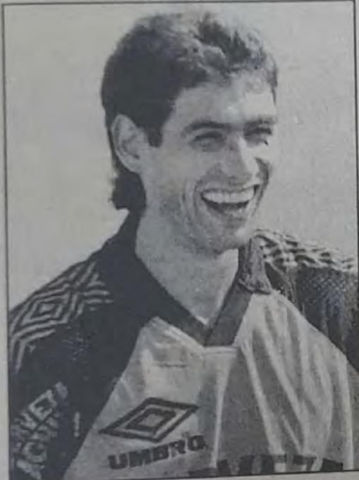
○ اسكوبار .. سقط صريع الرصاص ○

قرر عدم تولى منصب المدرب المستقيل فرانثيسكو ماتوراننا وذلك في أعقاب حادث الاغتيال. وأدان سيب بلاتر الأمين العام للاتحاد الدولي لكرة القدم الحادث وقال «إن هذا أكثر الأعمال إجراماً نشهدها في كأس العالم. إنه عمل لا يفهمه أحد ويدينه الجميع».