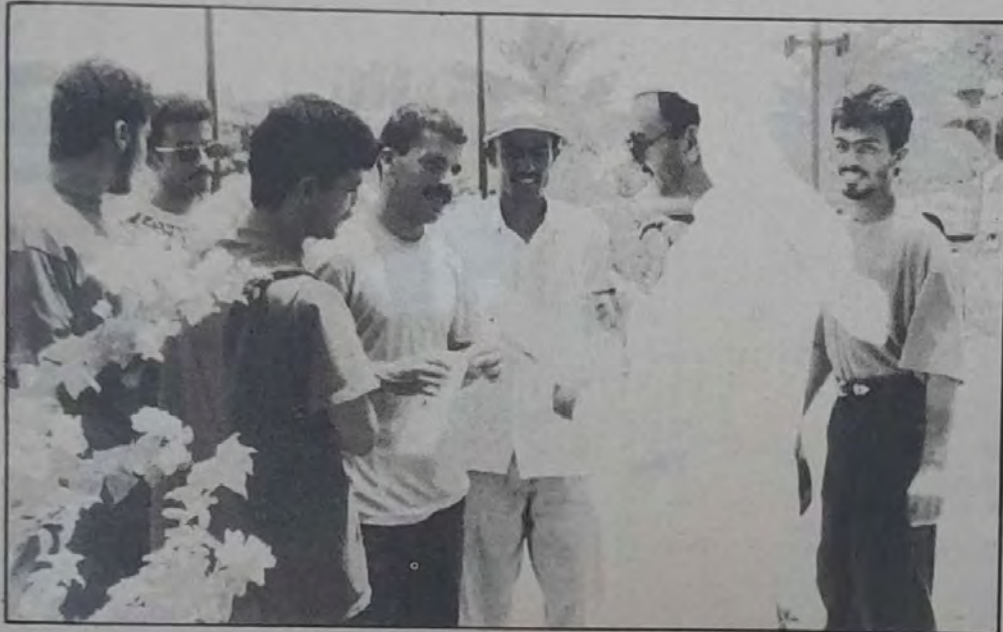
○ رشحنا الوزارة للتوظيف لكن الشركات والمؤسسات ترفضنا ○