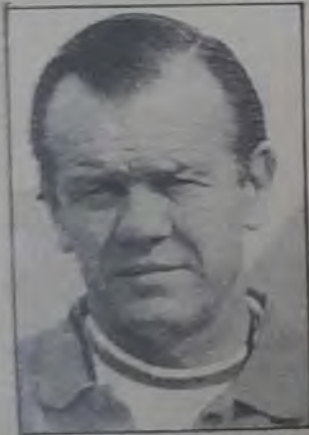
○ سولاري مدرب السعودية ○