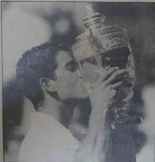
○ سامبراس يقبل الكأس بعد اعلان فوزه ○

وقد نجح اللاعب الأمريكي (بيت سامبراس) في الاحتفاظ بلقبه كبطول ويمبلدون بعد أن تغلب في المباراة النهائية على الكرواتي غوران ايفانيسيفيتش (٦/٧ - ٦/٧ - ٦/٧ - صفر) وهذا الفوز أثر على الترتيب العالمي للاعبى كرة المضرب.. فجاء سامبراس في المركز الأول (٥٤٠٥) نقطة، ثم ايفانيسيفيتش (٣١٠٥) نقطة، والألماني مايكل شتدش في المركز الثالث (٢٨٩٥) نقطة، والاسباني سرجي بووغير رابعا (٢٧٥٧) نقطة، والأميركي تود