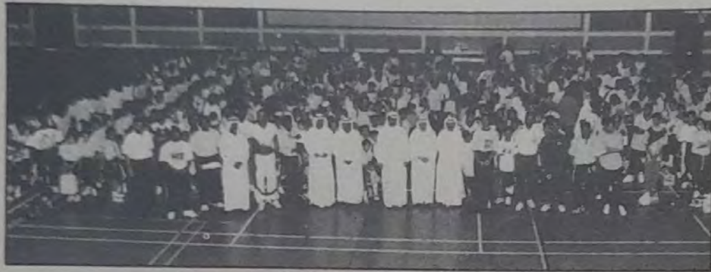
○ رئيس النادي الأهلي مع المشاركين في برنامج المركز الصيفي ○

رئيس النادي الأهلي بعد افتتاح المركز الصيفي: برامج رياضية وجولات ميدانية لمختلف معالم البلاد