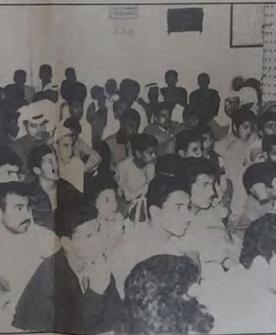
○ المنبر الحسيني قادر على طرح ثقافة متوازنة تلبي حاجة الإنسان العادي والمتخذ