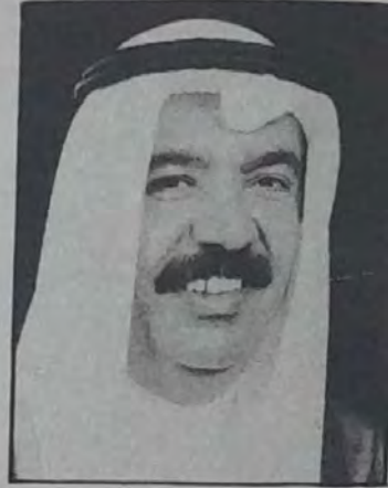
○ الشيخ عيسى بن علي آل خليفة وزير العمل والشؤون الاجتماعية ○