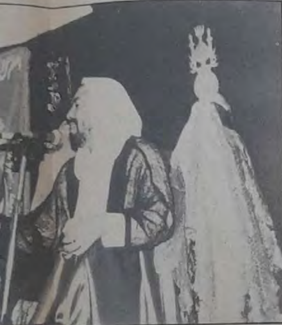
○ ارتباط المنبر بالمصيبة قضية تستند إلى قوى شرعية ○

● الخطاب وسيلة من وسائل الاتصال، وخطاب المنبر هنا وسيلة اتصال ولكن من طرف واحد بمعنى أنها وسيلة إرسال فقط وليس