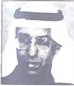
ابراهيم عبد الكريم

صدر عن حضرة صاحب السمو الشيخ عيسى بن سلمان آل خليفة أمير البلاد المفدى ثلاثة مراسم بانايات وزارية يعهد الأول بموجبه الى السيد ابراهيم عبدالكريم وزير المالية والاقتصاد الوطنى اضافة الى عمله القيام باعمال الشيخ خالد بن عبدالله آل خليفة وزير الإسكان وذلك مدة غيابه في الخارج والثاني يعهد بموجبه الى السيد طارق عبدالرحمن المؤيد وزير الاعلام اضافة الى عمله القيام باعمال السيد حبيب احمد قاسم وزير التجارة والزراعة وذلك مدة غيابه في الخارج والثالث يعهد بموجبه الى الدكتور علي محمد فخرو وزير التربية والتعليم اضافة الى عمله القيام باعمال الشيخ عبدالله بن خالد آل خليفة وزير العدل والشئون الاسلامية وذلك مدة غيابه في الخارج .