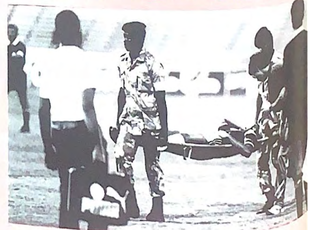
وزارة الدفاع شاركت في هذا الحدث المهم، فكانت متواجدة دائما.