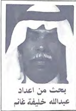
بحث من اعداد عبدالله خليفة غانم

خاصة سميت (بالمحكمة المشتركة) عام ١٩٣٧م كما قلت سابقا حيث كانت تنظر في القضايا التي يكون احد طرفيها من ابناء البحرين وعلى أن يكون الطرف الآخر من احدى الجنسيات الاجنبية واستمرت هذه المحكمة حتى عام ١٩٥٢م حتى اعيدت تلك القضايا الى القضاء البحريني .