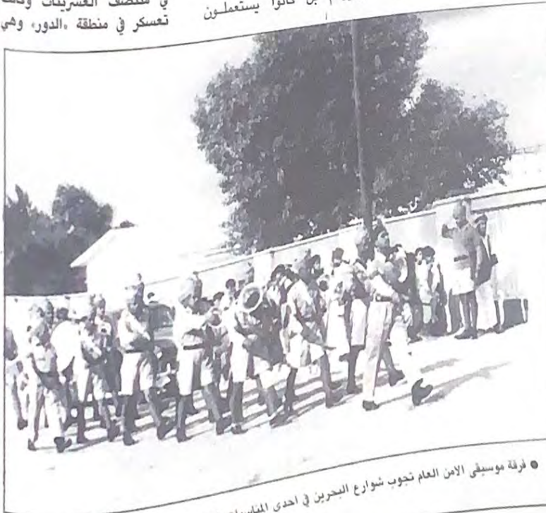
● فرقة موسيقى الأمن العام تجوب شوارع البحرين في إحدى المناسبات ١٩٢٩ ●

انشئت فرقة الهجانة (الجمال) في منتصف العشرينات وكانت تعسكر في منطقة «الدور» وهي