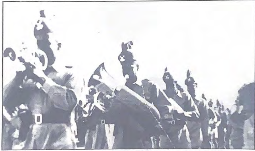
فرقة موسيقى الامن العام في المرحلة الثانية

كما اشرت سابقا بأن المغفور له الشيخ حمد بن عيسى بن علي آل خليفة حاكم البحرين السابق عندما قام بافتتاح مبنى المحاكم الجديد في ١٨ نوفمبر ١٩٣٧م وقد ذكر بعض المؤرخين بأن هذا المبنى اقيم على موقع بحري في الأصل وقد تكلف بنائه مبلغ طائلة جدا حيث بلغت مع تكاليف الأرض والبناء حوالي ( ٨١٠٠٠ روبية) بما يعني بأن هذا المبلغ الذي صرف على انشاء هذا المبنى اصبح اليوم (مركز التراث الشعبي التابع لوزارة الاعلام) ، كان مسابرا للحركة المتطورة في شئون القضاء وقد اشتمل هذا المبنى بجانب المحاكم دائرة الأوقاف ودائرة اموال القاصرين ودائرة الطابو (التسجيل العقاري في الوقت الحاضر) ، اما الطابق العلوي فقد خصص قسم منه كمسكن لكبار الموظفين من الأجانب وهذا المبنى شهد احداث تاريخية في القضاء البحريني .