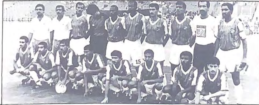
فريق النادي العربي الكويتي

طبعاً هذا مرور سريع على البطولة وستكون لنا وقفة مطولة معها في الاسبوع القادم