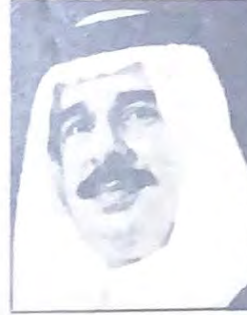
• سمو الشيخ حمد •

تنظم اللجنة العليا لانشطة طلبة البحرين في الخارج لقاء عام مع الشيخ عيسى بن راشد آل خليفة رئيس المؤسسة العامة للشباب والرياضة وذلك في الساعة السادسة والنصف من مساء يوم الاربعاء الموافق للثالث والعشرين من الشهر الحالى بمدرسة ام ايمن الابتدائية وستناول الشيخ عيسى في هذا اللقاء كافة الأمور المتعلقة بشئون الطلبة خارج البحرين وداخلها وعدد من الأمور التي تهم الطالب