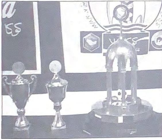
○ كأس البطولة يتصدر الكؤوس الأخرى في الدورة ○