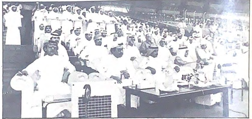
○ سمو الشيخ محمد بن عيسى آل خليفة ورؤساء الوفود الخليجية يحضرون مباراة المحرق والهلال ○

المهم ان المحرقاوية ربما وضعوا المنظم القادم للبطولة في حرج وفتحوا باب التحدي في هذا المجال وهو سيغطي البطولات القادمة اهتماما اكبر كما هي العادة السائدة في تنظيم البطولات الخليجية للمنتخبات .