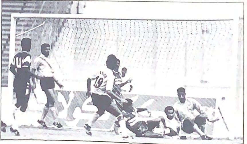
○ لقاء المحرق وفنجا ○

البطولة السابعة للاندية الابطال بمجلس التعاون الخليجي انتهت وأسدل الستار على احداثها ومرت ايامها سريعة على المشاركين فيها من إداريين ومدربين ولاعبين وعلى متبعيها من المتفرجين .. وبرغم حرارة الجو ورطوبته الحائقة فإن الحدث كان مثيرا وشبيها بالماراثون .. وسنظل إثارة قائمة في عيون متبعيه من الاشقاء . فأبناء القلعة الحمراء نجحوا نجاحا باهرا في التنظيم الذي كان موضع اشادة الجميع ..