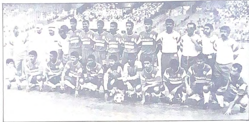
○ فريق نادي المحرق ○