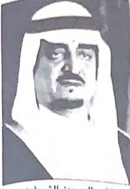
○ خادم الحرمين الشريفين ○