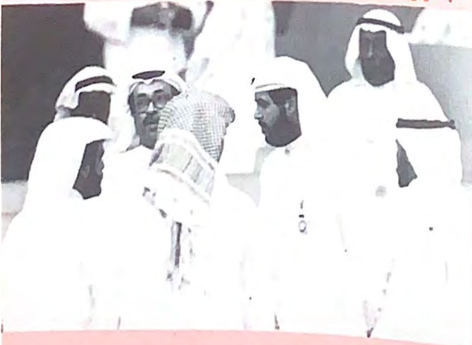
حديث ما بين الشوطين « أحمد وأبو عبدالله وخليفة » عن هموم الدورة!!!