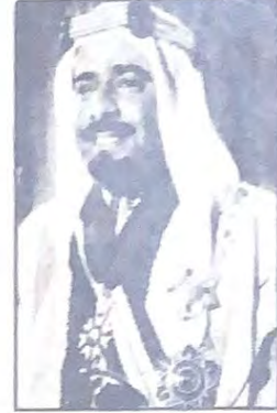
امير البلاد المفدى

تلقت جمعية مكافحة التدخين رسالة شكر من منظمة الصحة العالمية تثني فيها على جهود الجمعية ونشاطها وكذلك تشيد بالتعاون معها حيث ان الجمعية قد قدمت لمنظمة الصحة العالمية عدة افلام وشرائح خاصة بالتنوع ضد التدخين وقد قامت المنظمة بالاستعانة بها في إنتاج الفيلم الصحى الذى اعدته بمناسبة اليوم العالمى الثانى لمكافحة التدخين وقد جاء في النشرة الخاصة بانباء الاقليم ان منظمة الصحة العالمية مدينة لوزارة الصحة في البحرين ولجمعية مكافحة التدخين لا رسالها مجموعة من الافلام عن التدخين كان لها فائدتها في إنتاج فيلم المنظمة وقد تحملت المنظمة تكاليف اعداد وانتاج هذا الفيلم