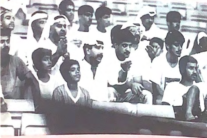
سمير سعيد نجم الكويت من لاعب أساسي الى كراسي الجمهور..