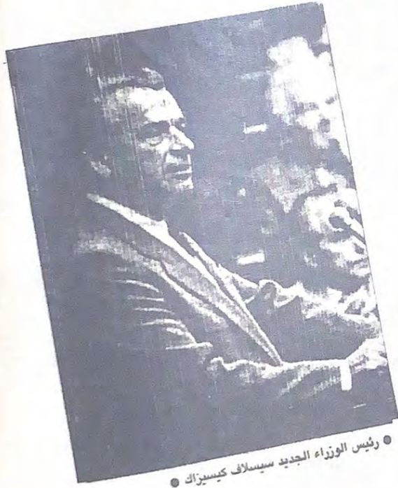
● رئيس الوزراء الجديد سيملاف كيسيزاك

تقدم خيل سمولو عن مجلة التانصر ١٤ أغسطس ١٩٨٩