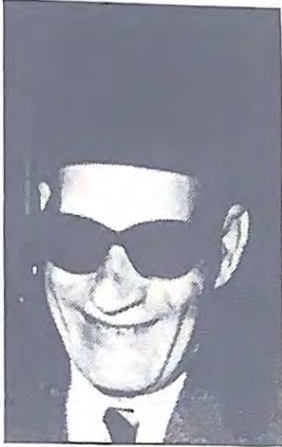
د. طه حسين