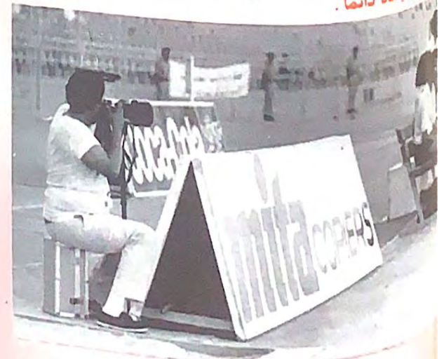
جوفاني مصور «الرياضية» أضبط يا حكم (غير مكانه)!!!