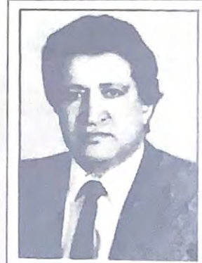
مقال على حلقات يكتبه الدكتور مكى محمد سرحان