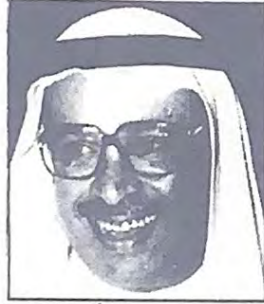
الشيخ عيسى بن راشد آل خليفة

اضاف « انا كنت معترضاً على اقامة البطولة في شهر أغسطس ولكنني بعد ان قرأت التقارير اكتشفت اننا امام خيارين ، إما اقامتها في هذا الموعد او عدم اقامتها بسبب ظروف الاشقاء .. واعتقد ان موعد البطولة اثر على مستويات الاداء لدى اللاعبين ، ونادي المحرق بذل جهودا كبيرا لتنظيمها بعد ان واجه مشكلة الوقت وقام بتذليل جميع الصعوبات واستطاع احراز النجاح .. »