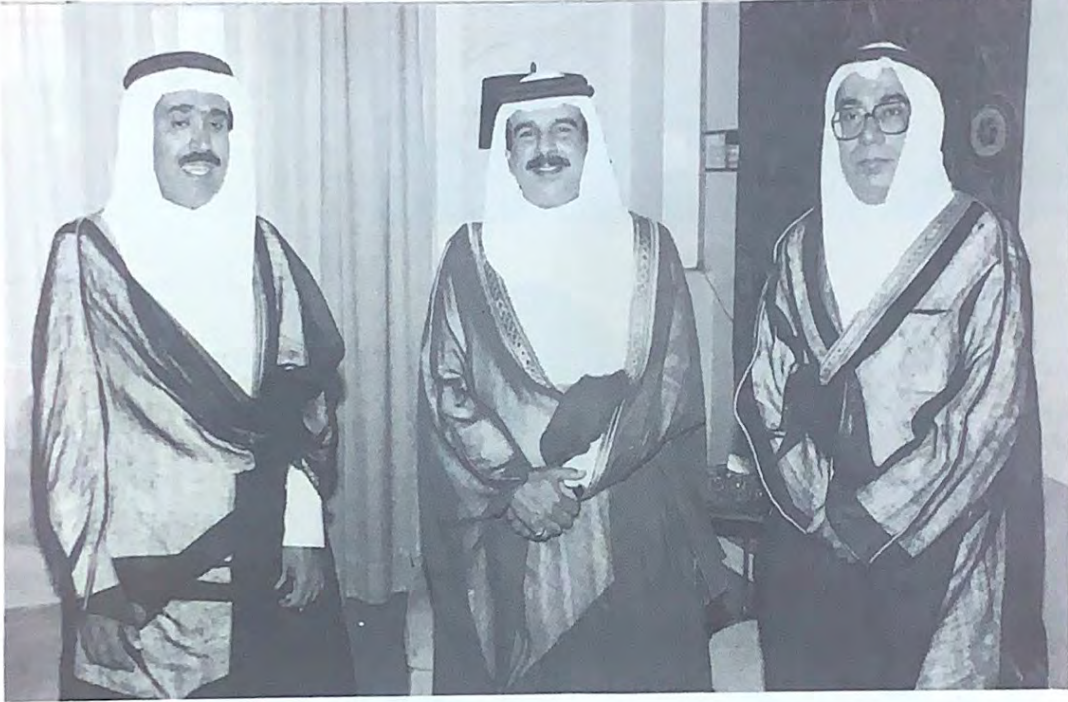
سمو ولي العهد في حديث صحفي هام :

□ العدد ٧٥٧ - الاثنين ٢١ أغسطس ١٩٨٩ - ١٩ محرم ١٤١٠ هـ - ٢٠٠ فلس □