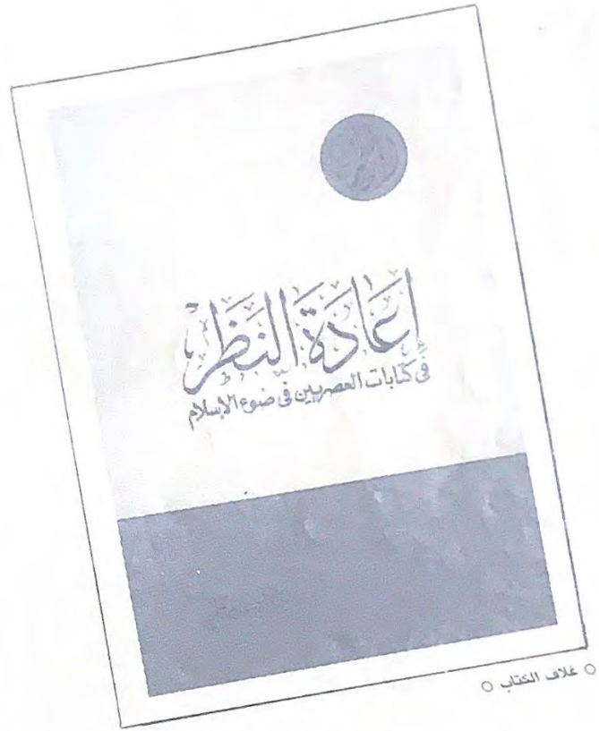
○ غلاف الكتاب ○